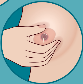
ነጸብዕትኺ ብዝተኻለለ ጸቐጥኪ ንቐድሚት ትሰሕብዮ።