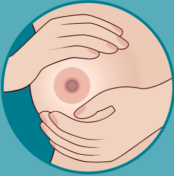
አፍኩስ አቢልኪ ጥብኪ ተንቐላቐሶ